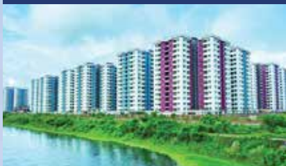
UTTARA MODEL TOWN (3RD PHASE)