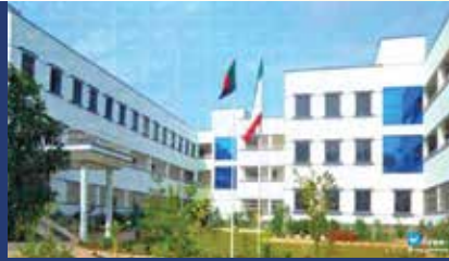
CITY UNIVERSITY BANGLADESH