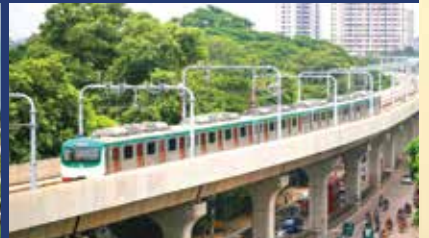
DHAKA METRO / MRT5 STATION