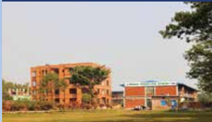
MANARAT INTL' UNIVERSITY