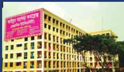
AYUB SALEHA COMPLEX (CADET MADRASHA)